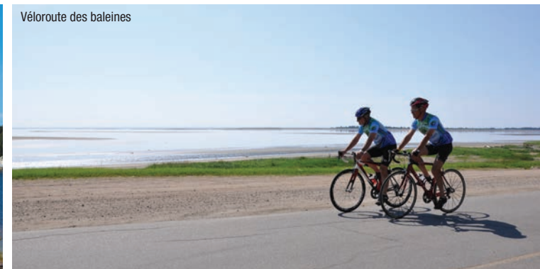
Véloroute des baleines