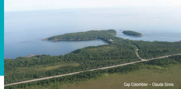
Cap Colombier – Claude Sirois