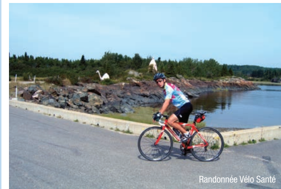
Randonnée Vélo Santé

595, route 138 Ragueneau G0H 1S0 418 567-8912 tourismemanicouagan@gmail.com