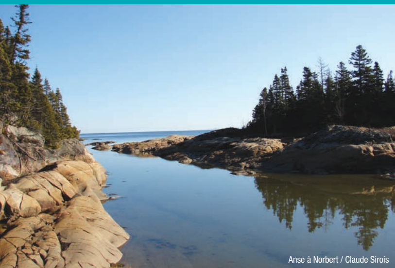
Anse à Norbert / Claude Sirois

Les Îlets-Jérémie et l'anse à Norbert (Îlets-Jérémie & Anse à Norbert) – Randonnée pédestre (Hiking) – Sentier de la Rivière-aux-Rosiers (Rivière-aux-Rosiers Trail) – Archipel et quai de Ragueneau (Ragueneau Archipelago & Pier) – Plage (Beach) – Pessamit (Pessamit)