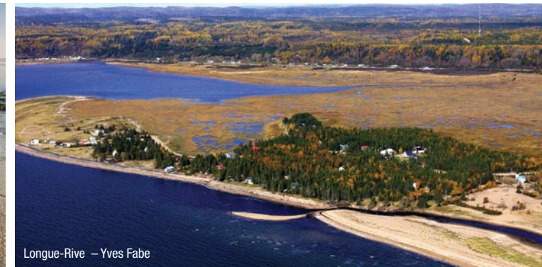
Longue-Rive – Yves Fabe