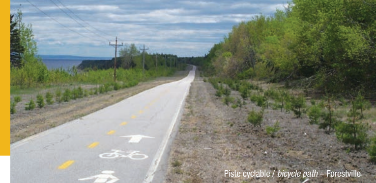
Piste cyclable / bicycle path – Forestville