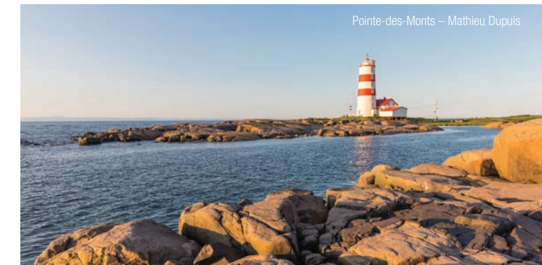
Pointe-des-Monts – Mathieu Dupuis